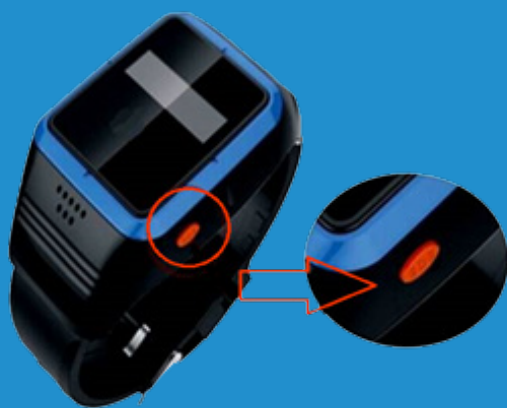
Die mOCare Notruf-Uhr-“Sender“

mOCare ist eine eingetragene Marke der mobileObjects AG